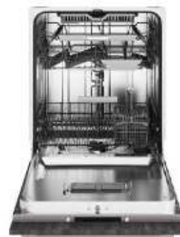
1 tiroir + 2 paniers en acier inoxydable FlexiRacks™ Premium