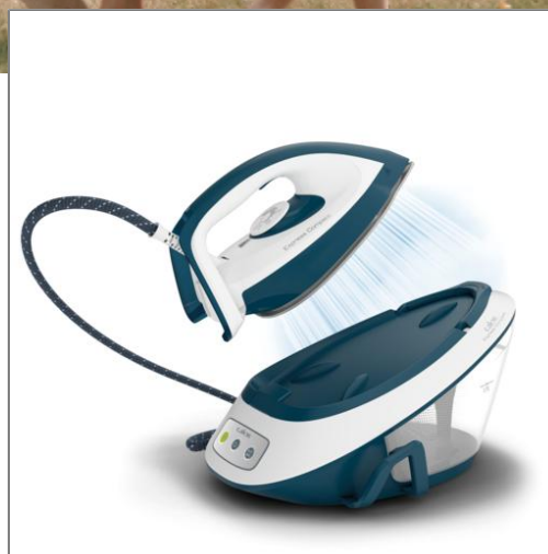
EXPRESS COMPACT Centrale vapeur SV7110C0